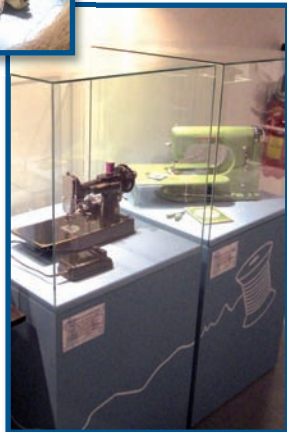
La couture moderne grâce aux machines à coudre : un métier, un loisir, un savoir-faire

qui est à la base du développement économique de la vallée : le fil de lin a tissé des relations particulières entre les habitants. De la culture de cette plante au travail des couturières, partagez ce savoir-faire textile exceptionnel et faites un peu de lèche-vitrine devant une boutique de mode de 1900.