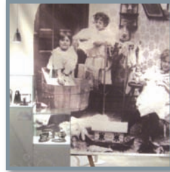
Pour les manches ballon, pour les chapeaux ou pour glacer le tissu, les fers à repasser s'adaptent aux caprices de la mode

est une nécessité pour les habitants : la buanderie, le lavoir, la blanchisserie, ces lieux dédiés aux soins du linge révèlent les pratiques anciennes et leurs évolutions avec les progrès techniques.