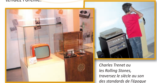
Charles Trenet ou Les Rolling Stones, traversez le siècle au son des standards de l'époque

du plaisir et de la liberté. Le confort entre dans les foyers et révolutionne les modes de vie. Les Picards ont désormais le temps et les moyens de s'intéresser aux arts populaires. Symboles de cette ouverture, les appareils de diffusion du son s'introduisent dans les foyers. La musique du monde entier résonne dans la vallée : tendez l'oreille.