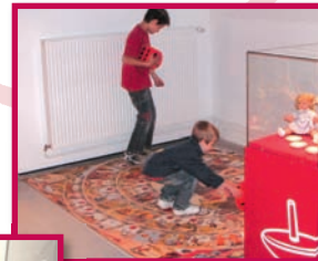
Et si on s'arrêtait pour jouer ?

avec ses jouets, sa vie scolaire, sa mode et ses rêves, revêt une dimension particulière. Place à l'amusement, en retrouvant ses jouets d'enfance, en lançant le dé d'un jeu de l'oie géant, en s'immerçant dans la chambre d'enfant de nos grands parents et en découvrant la fabuleuse histoire des poupées. Certains jouets sont indémodables, d'autres sont nés des découvertes scientifiques. Tous permettent de mieux comprendre la vie des enfants depuis plus d'un siècle.